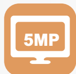
5 M P