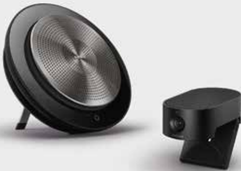
Jabra Speak 750 和 PanaCast 20 居家辦公的完美選擇