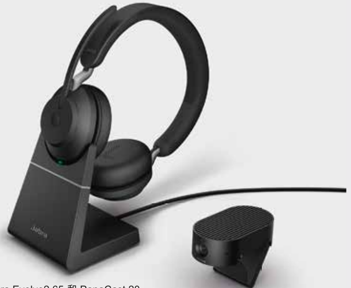
Jabra Evolve2 65 和 PanaCast 20 靈活協作的理想選擇