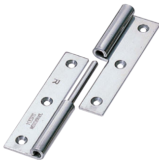
B-1004-1-R (ステンレス製の標準は穴あきです) Standard of stainless steel-made is supplied with hole.